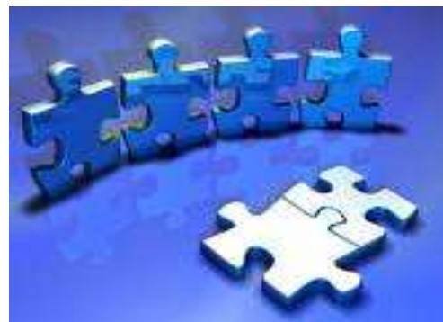
El Coaching facilita el encaje entre las personas: Docentes, alumnos, equipo y relaciones personales