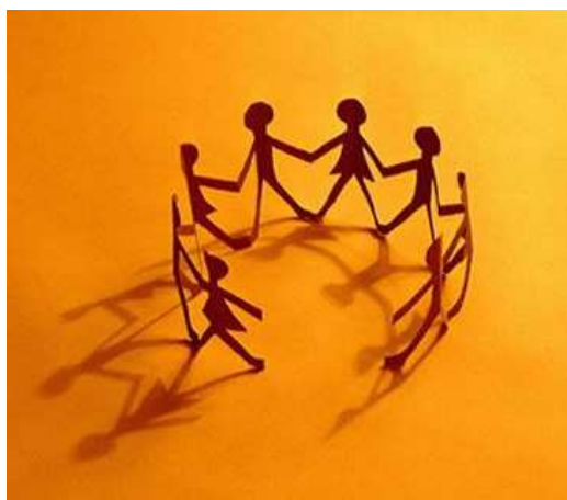
La regulación emocional es la base de cualquier relación. Necesitamos aprender para mejorar la comunicación.

Influir para que la otra persona haga o actúe de determinada manera